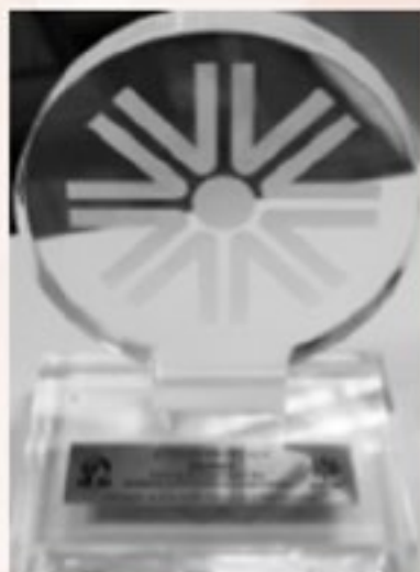
Prêmio Nacional de Seguridade Social Categoria: Educação Financeira e Previdenciária